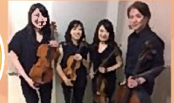
群馬交響楽団員による弦楽四重奏