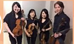
群馬交響楽団員による弦楽四重奏