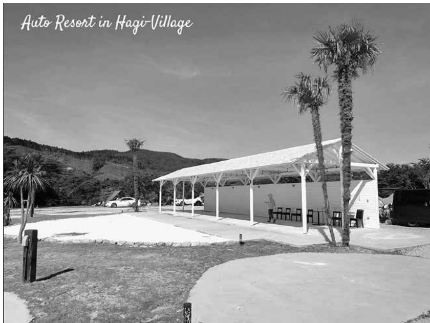
Auto Resort in Hagi Village

は、クルマで訪れて、滞在して、そして、地域を体験していただくクルマ旅の拠点と位置づけました。当社の事業展開の方角として、一つ目は、旅するクルマの開発販売です。二つ目は、モノからコト体験への変換。クルマを使ってどんなライフスタイルが待っているかを伝えていく必要があります。三つ